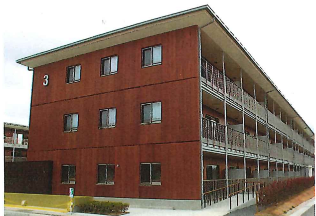
製造元：アクソノーベル デコラティブペイント社 オランダ 総代理店/総発売元：

屋内木部には、 屋内用塗料(F☆☆☆☆) をご利用ください。 セトールBLデコール、セトールBLユニットップ、水性フローア